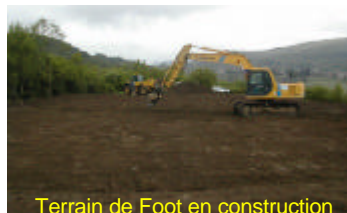
Terrain de Foot en construction